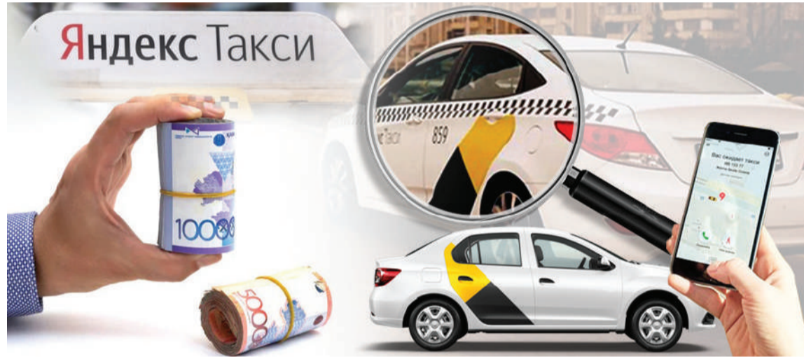
ЕМАР ҚАБА (КОЛАЖ)

Сондықтан уәкілетті мемлекеттік органдардың өкілдері бұл істі өз қолына алды: тасымал қызметтерін көрсету саласында отандық ІТ-өнімдерді қолдау үшін Relog көлік-тасымал компаниясының, «Такси5+», Араги, «Төлем Такси» жолаушылар тасымалы сервисінің, Choco Holding, Meta-поіа такси шақыру сервистерінің өкілдерімен кездесіп, келіссөздер өткізіп жатқан көрінеді. Одан не нәтиже шығатыны белгісіз. Қазақстандық такси нарығы болса, күн сайын «Яндекстің» жұтқыншағына жұтылып барады.