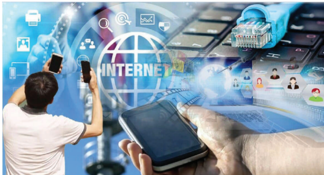
Елшар ҚАБА (коллаж)

Дамушы елдер қатары индустриялық экономиканы қалыптастырып үлгермей жаһандық нарықта цифрлық экономика өз ережелерін енгізе бастады. Ол үлкен деректер технологиясы негізінде құрылады және инновациялық шешімдердің дамуына, экономикалық көрсеткіштердің өсуіне ықпал етеді. Қазір бұл еліміздің ұзақмерзімді стратегиялық мақсаттарына негіз болып отыр. Мұндай экономика нарықтағы процестердің жаһандануына және қоғамның әлемдік экономикаға интеграциясына оң әсер етпек. Әсіресе, халықты жұмыспен қамтуға, бизнес субъектілерінің бәсекеге қабілеттілігін арттыру және халықтың өмір сүру сапасын жақсартуға сеп болады.